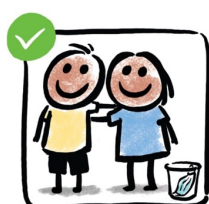
Le Collectif Parents